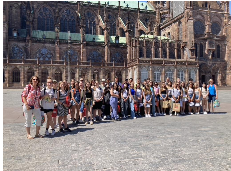
vor dem Straßburger Münster